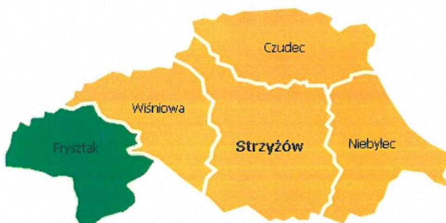
Rysunek 1. Gmina Frysztak w powiecie strzyżowskim

Gmina Frysztak zajmuje obszar 91 km 2 . Według danych GUS z końca 2018 roku Gmina liczy 10.409 mieszkańców, a gęstość zaludnienia to w przybliżeniu 115 osób/km 2 . Gmina Frysztak leży w zachodniej części powiatu strzyżowskiego. Bezpośrednio graniczy z następującymi jednostkami: Brzostek, Jasło, Kołaczyce, Wielopole Skrzyńskie, Wiśniowa, Wojaszówka.