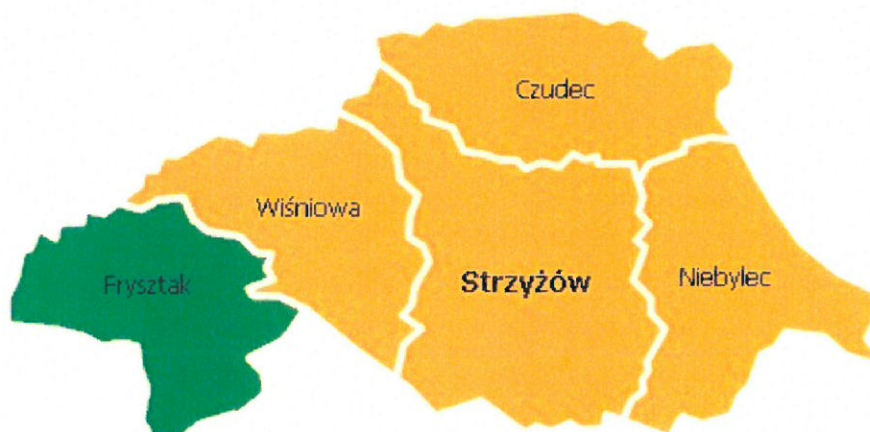
Rysunek 1. Gmina Frysztak w powiecie strzyżowskim

Gmina Frysztak zajmuje obszar 91 km 2 . Według danych GUS z końca 2016 roku Gmina liczy 10.503 mieszkańców, a gęstość zaludnienia to w przybliżeniu 116 osób/km 2 . Gmina Frysztak leży w zachodniej części powiatu strzyżowskiego. Bezpośrednio graniczy z następującymi jednostkami: Brzostek, Jasło, Kołaczyce, Wielopole Skrzyńskie, Wiśniowa, Wojaszówka.