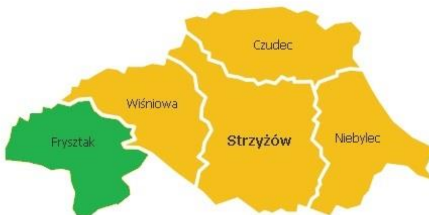
Rysunek 1. Gmina Frysztak w powiecie strzyżowskim

Gmina Frysztak zajmuje obszar 91 km 2 . Według danych GUS z końca 2015 roku Gmina liczy 10.537 mieszkańców, a gęstość zaludnienia to w przybliżeniu 116 osób/km 2 . Gmina Frysztak leży w zachodniej części powiatu strzyżowskiego. Bezpośrednio graniczy z następującymi jednostkami: Brzostek, Jasło, Kołaczyce, Wielopole Skrzyńskie, Wiśniowa, Wojaszówka.