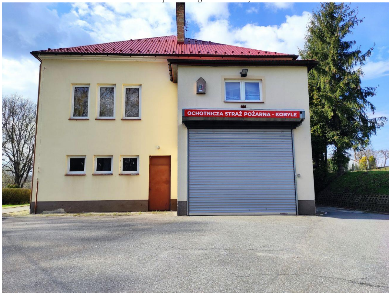
Budynek wiejski oraz remiza OSP Kobyle