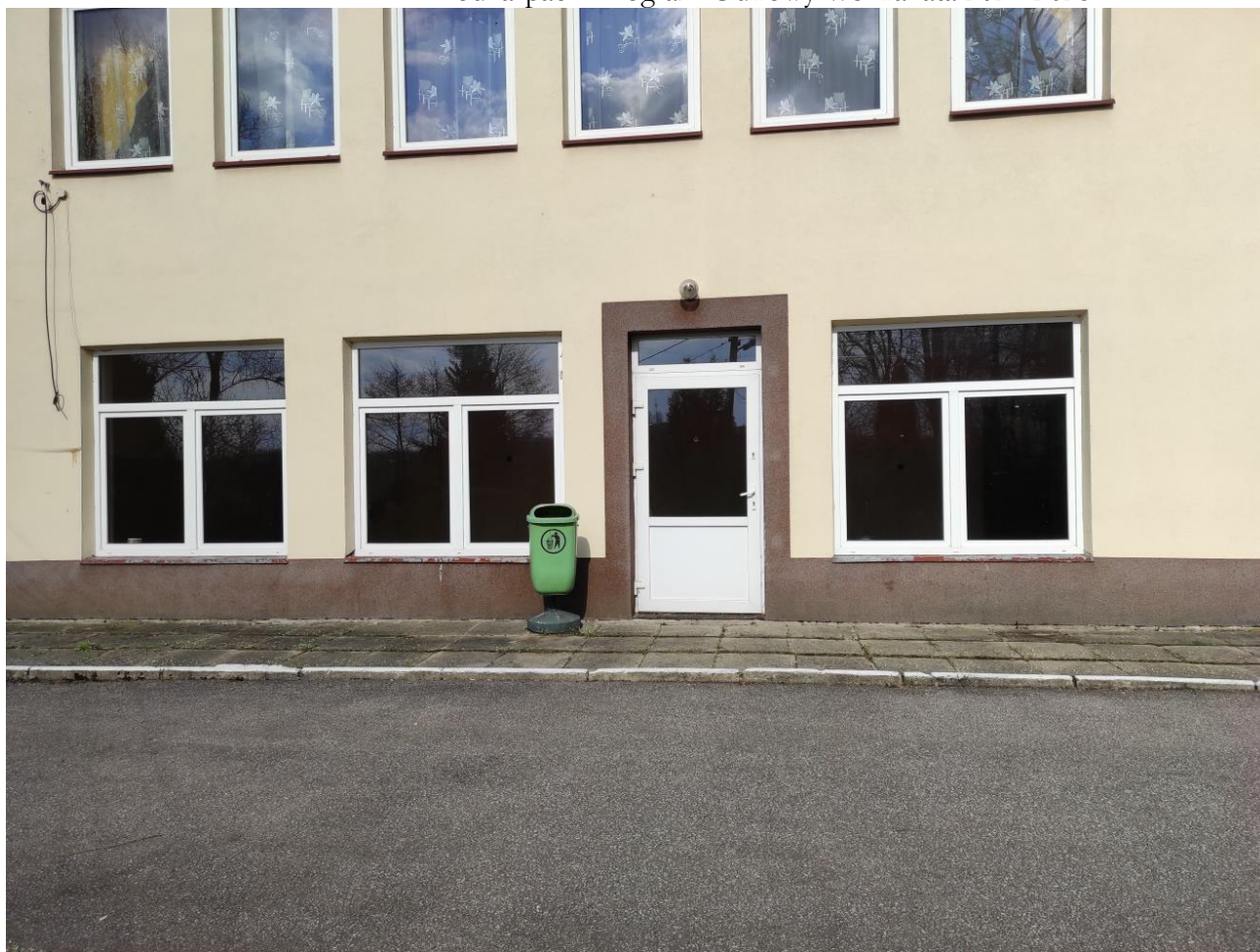
Parter domu wiejskiego z przeznaczeniem na Izbę Pamięci oraz siłownię