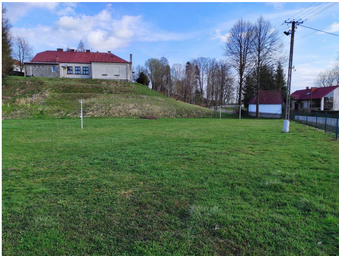
Plac rekreacyjny przy szkole z przeznaczeniem na plac zabaw