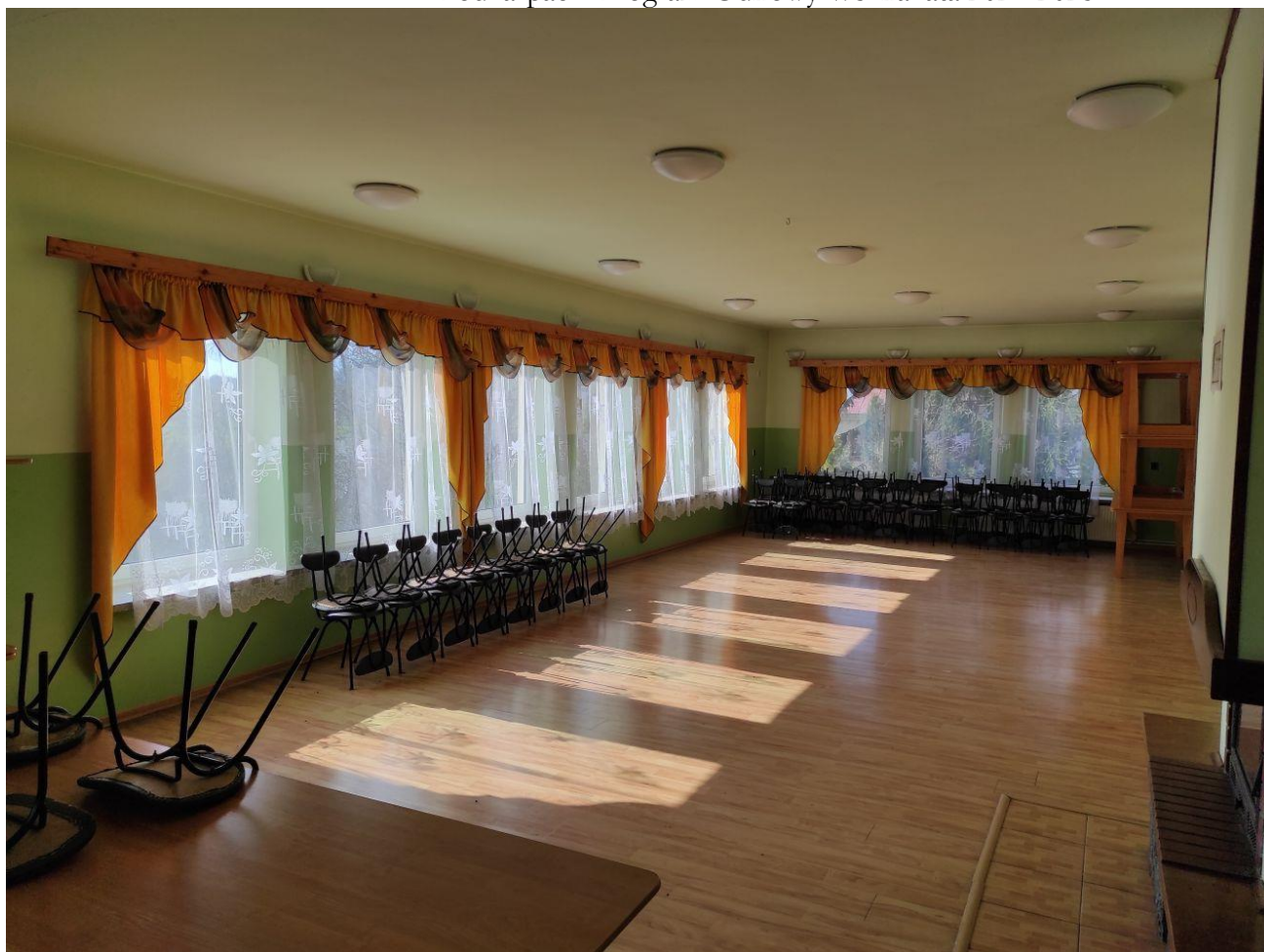
Sala w budynku wiejskim