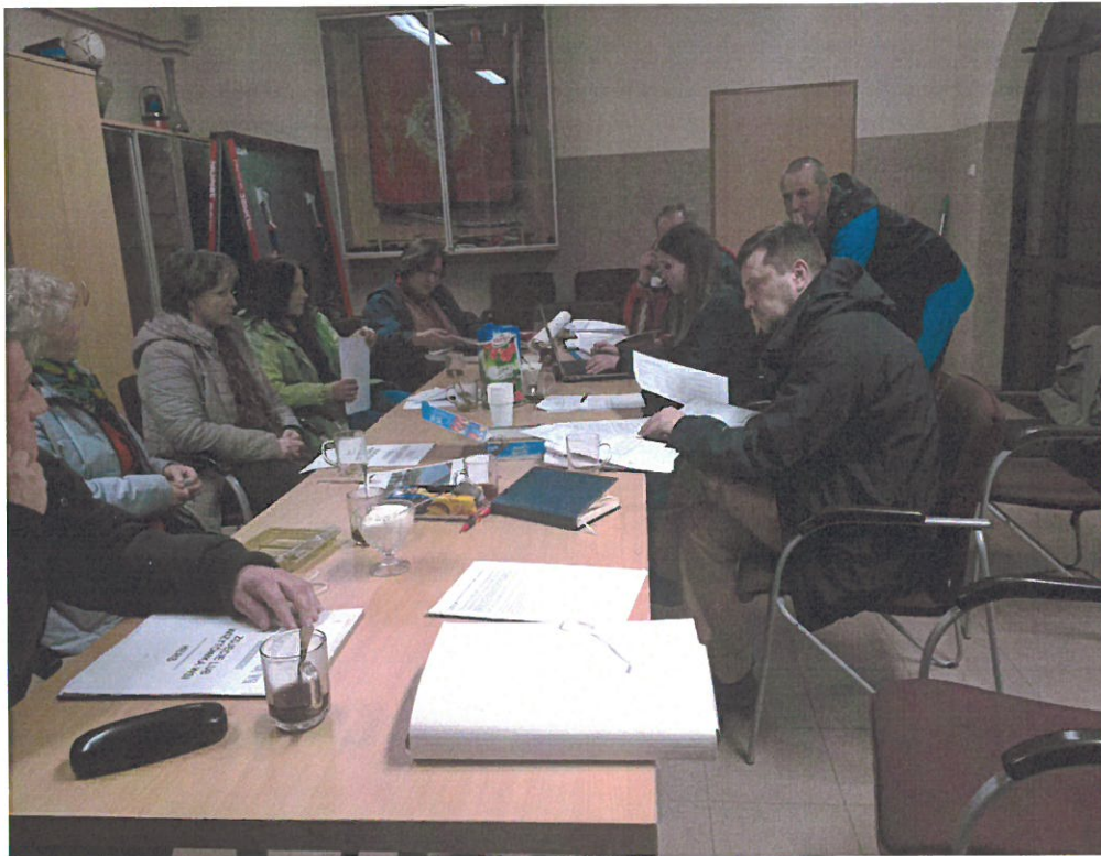
Grupa Odnowy Wsi w czasie opracowywania Sołeckiej Strategii Rozwoju, Dom Ludowy w Cieszynie, 26.04.2017r.