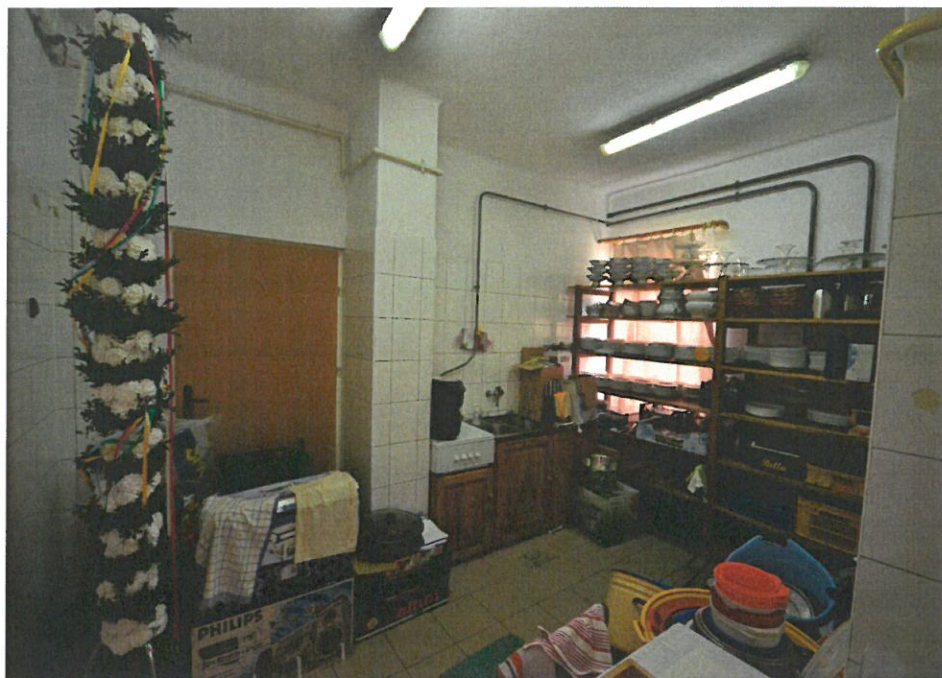
Pomieszczenie gospodarcze w Domu Ludowym w Cieszynie