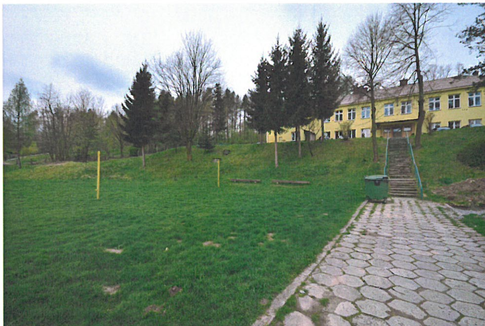
Widok na boisko sportowe i Szkołę w Cieszynie