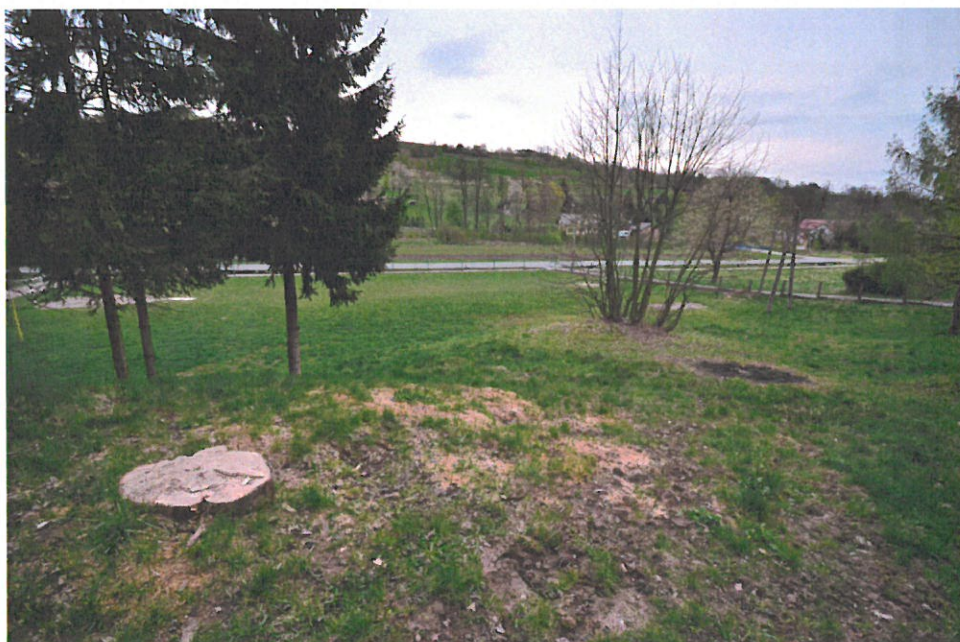
Miejsce na budowę altany biesiadnej