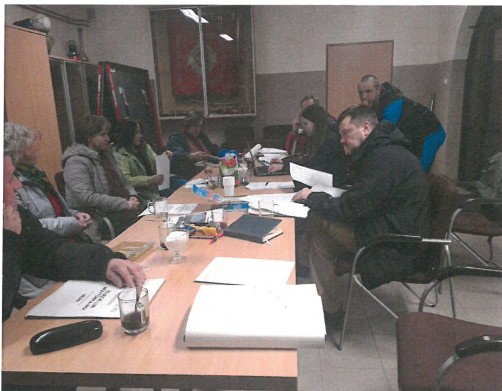
Grupa Odnowy Wsi w czasie opracowywania Sołeckiej Strategii Rozwoju, Dom Ludowy w Cieszynie, 26.04.2017r.