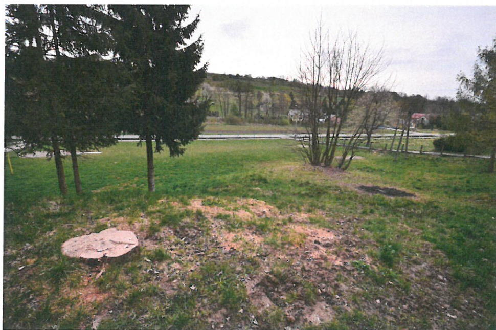
Miejsce na budowę altany biesiadnej