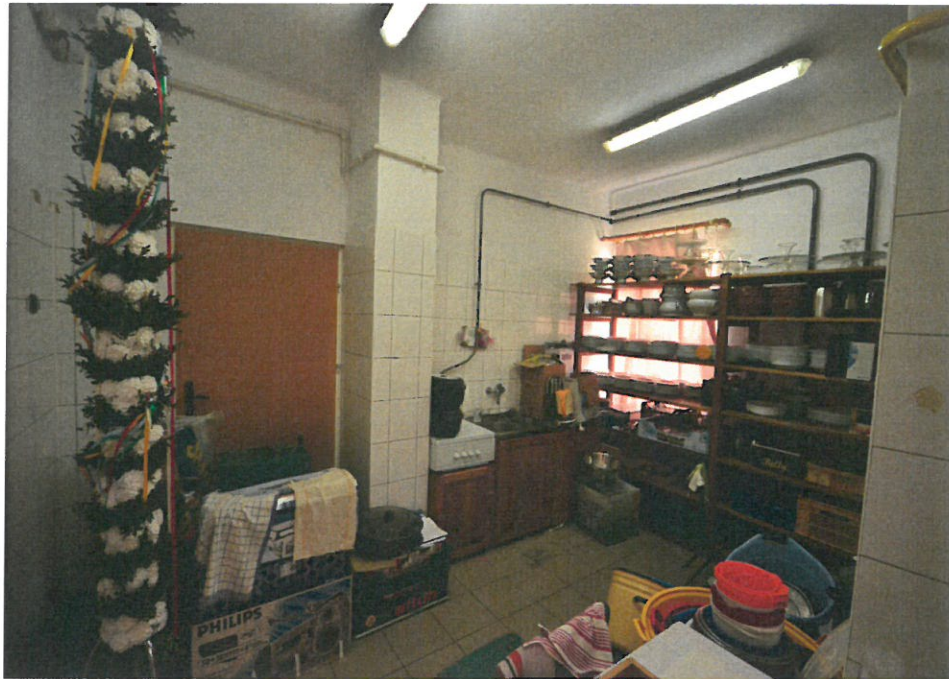
Pomieszczenie gospodarcze w Domu Ludowym w Cieszynie