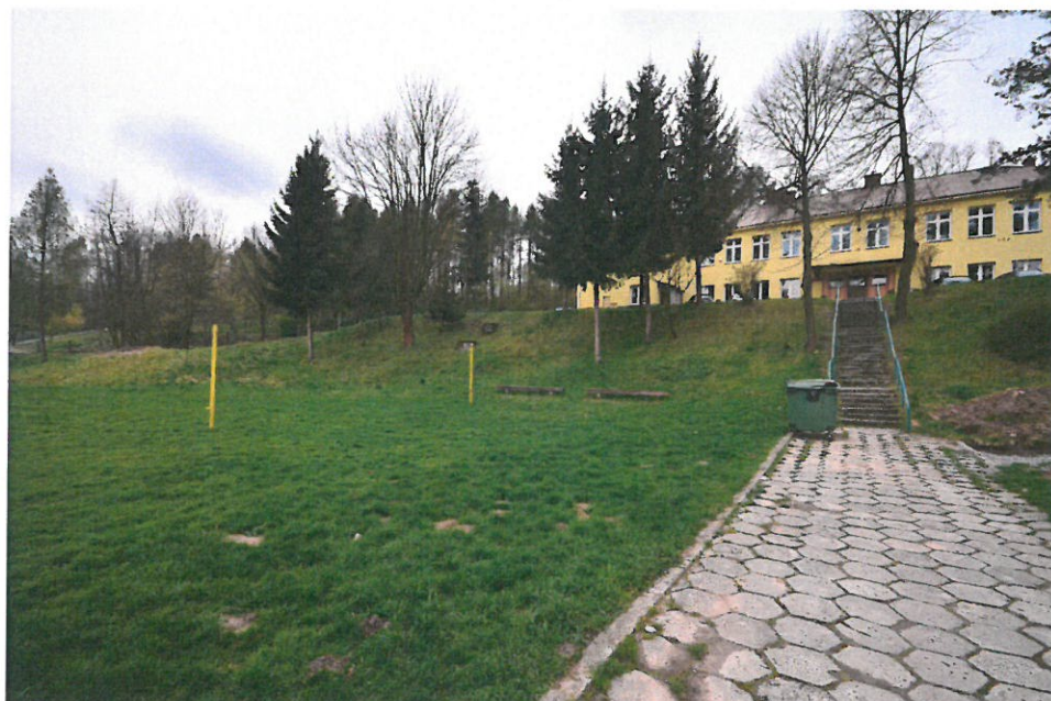
Widok na boisko sportowe i Szkołę w Cieszynie